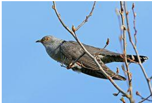
obr. 22. Kukačka obecná

Brhlík lesní makově šedý pták s černou páskou přes oko, který obratně šplhá po stromech, často hlavou dolů. Jeho zpěv je trylkovitý, v základě zní jako „kvikvikvi...“.