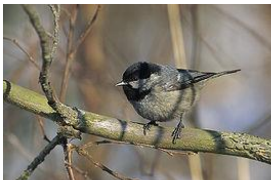
obr. 20. Sýkora uhelníček

Sýkora koňadra je velká asi jako vrabec, ale štíhlejší. Je to naše největší sýkora. Hlavu má černou, jen tváře a příuší jsou bílé. Černá barva pokračuje i na náprsenku a zužuje se do černého pruhu, který se táhne přes břicho. Hřbet je žlutavý až zelený, břicho žluté, křídla jsou tmavá modrošedá s nevýraznou bílou páskou. Zobák je silný. Hnízdí ráda v ptačích budkách dvakrát za rok. V zimě ráda navštěvuje krmítka. O sýkorkách se říká, že čířikají.