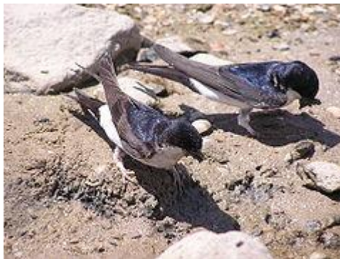
obr.28. Jiříčka obecná

Vrabec polní se liší od vrabce domácího, bílými tvářemi s černou skvrnkou a čokoládově zbarvenou hlavou. Hnízdí dvakrát do roka v dutinách stromů ojediněle v budkách.