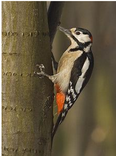
obr.23. Strakapoud velký

Strakapoud velký má velké skvrny na lopatkách. Stavbou těla je skvěle přizpůsoben životu na stromech. Jeho čtyři prsty, z nichž dva směřují dopředu a dva dozadu, jsou opatřeny zahnutými drápy, které usnadňují šplhání a jeho tuhá ocasní pera při něm slouží jako opora těla. K rozbíjení dřeva má velmi silný, zašpičatělý zobák. Díky jeho velmi silným krčním svalům je schopen do dřeva narážet velkou rychlostí. Nejhojnější datel našich lesů.