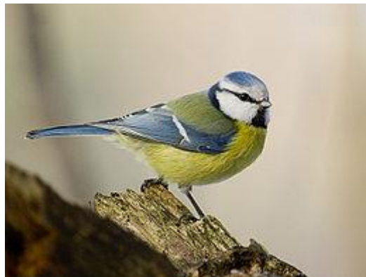
obr. 14. Sýkorka modřinka

Zvonek zelný má podsadité tělo, velkou hlavu a silný kuželovitý zobák. Samci jsou zbarveni zeleno-šedě, samice jsou nenápadně šedohnědé s jemnými tmavšími pruhy na svrchní části těla. Největší návštěvník krmítek. Ozývá se zvonečkovitým zpěvem. Přezimovává ve Středomoří.