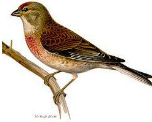
obr.29. Konopka obecná

Konopka obecná má záda sytě tmavě rezavo-hnědé. Hlava je šedá. Zpěv je příjemný a rozmanitý. Dovede dobře napodobit i zpěv jiných ptáků. Hnízdí dvakrát až třikrát do roka. Hnízdí nejraději v živých plotech.