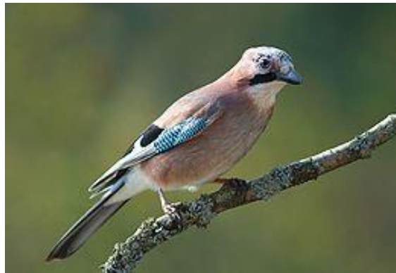
obr.25. Sojka obecná

Sojka obecná je oranžovohnědá s černým ocasem a zobákem, hnědýma očima. Na křídlech má modrá pírka. Ostražitý pták, svým varovným pokřikem upozorňuje na nebezpečí.