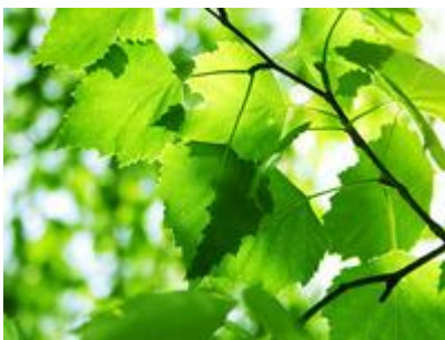
obr. 9. Bříza bělokorá