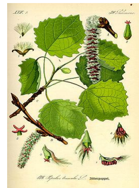
obr. 8. Topol osika