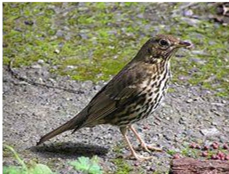
obr. 12. Drozd zpěvný

Kos černý je středně velký pták. Dospělý samec je matně černý s oranžově žlutým zobákem a žlutým kroužkem okolo očí. Samice je hnědavá s bělavějším hrdlem a nezřetelně skvrnitou hrudí, zobák i nohy jsou černé. Hnízdí pravidelně dvakrát iroce. Patří k nejlepším zpěvákům.