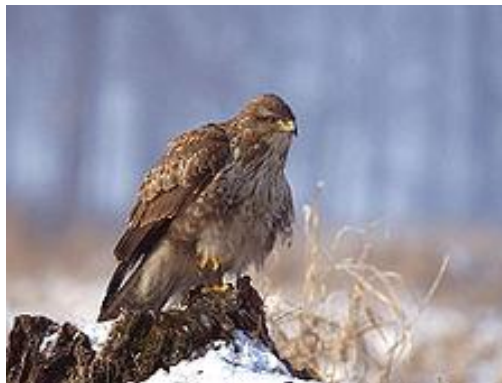
obr.24. Káně lesní

Strakapoud velký má velké skvrny na lopatkách. Stavbou těla je skvěle přizpůsoben životu na stromech. Jeho čtyři prsty, z nichž dva směřují dopředu a dva dozadu, jsou opatřeny zahnutými drápy, které usnadňují šplhání a jeho tuhá ocasní pera při něm slouží jako opora těla. K rozbíjení dřeva má velmi silný, zašpičatělý zobák. Díky jeho velmi silným krčním svalům je schopen do dřeva narážet velkou rychlostí. Nejhojnější datel našich lesů.