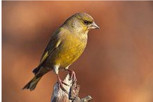
obr. 13. Zvonek zelený

Zvonek zelný má podsadité tělo, velkou hlavu a silný kuželovitý zobák. Samci jsou zbarveni zeleno-šedě, samice jsou nenápadně šedohnědé s jemnými tmavšími pruhy na svrchní části těla. Největší návštěvník krmítek. Ozývá se zvonečkovitým zpěvem. Přezimovává ve Středomoří.