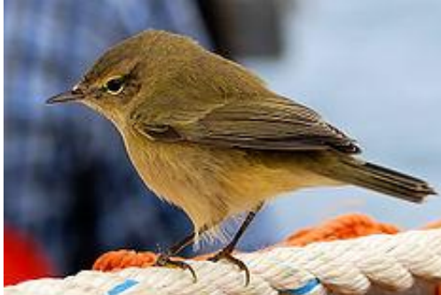
obr. 15. Budníček menší

Budníček menší je velmi malý pták dorůstající sotva 10 - 12 cm. Má zelenohnědou barvu, krátký zobák má zbarven tmavě. Žije na okrajích a pasekách všech lesů, kde nechybějí listnaté stromy. Nápadně se ozývá, nejčastěji několikrát opakovaným cilp-calp . Zimu přežívá ve Středomoří a severní Africe.