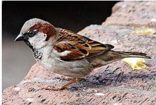
obr.30. Vrabc domácí

Konopka obecná má záda sytě tmavě rezavo-hnědé. Hlava je šedá. Zpěv je příjemný a rozmanitý. Dovede dobře napodobit i zpěv jiných ptáků. Hnízdí dvakrát až třikrát do roka. Hnízdí nejraději v živých plotech.