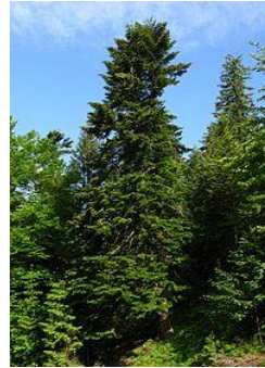
obr. 4. Jedle bělokorá