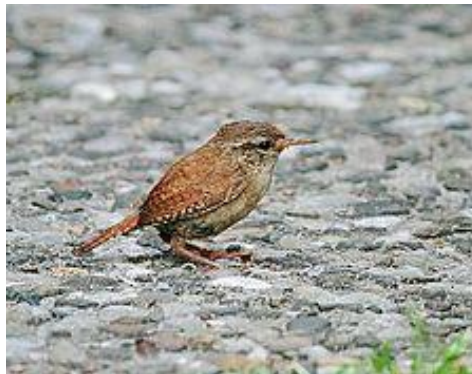
obr. 16. Střízlík obecný

Budníček menší je velmi malý pták dorůstající sotva 10 - 12 cm. Má zelenohnědou barvu, krátký zobák má zbarven tmavě. Žije na okrajích a pasekách všech lesů, kde nechybějí listnaté stromy. Nápadně se ozývá, nejčastěji několikrát opakovaným cilp-calp . Zimu přežívá ve Středomoří a severní Africe.