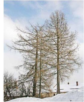
obr. 5. Modřín