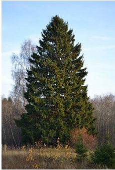
obr.2. Smrk ztepilý opadavý