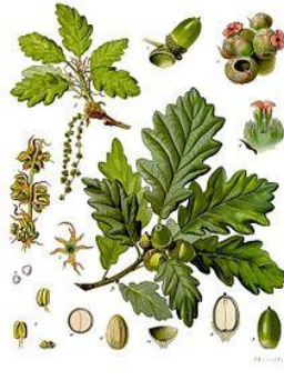
obr. 7. Dub zimní