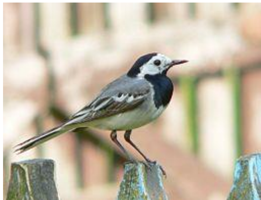
obr. 18. Konipas horský

Rehek domácí lidově nazývaný čermáček, kominíček. Hnízdí dvakrát do roka, nejvíce se vyskytuje lidských sídel. Je o něco menší než vrabec, od jiných drobných pěvců je dobře odlišitelný díky svému výrazně zářivě oranžovému ocasu, kterým neustále kmitá. Při vábení se ozývá ostrým fit-tek-tek , zpěv má krátký, zvučný s řadou švitoření a vrzavými úseky.