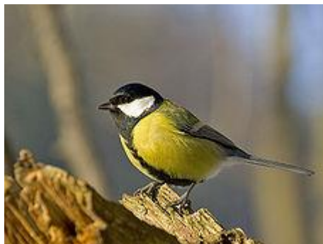
obr. 19. Sýkora koňadra

Sýkora koňadra je velká asi jako vrabec, ale štíhlejší. Je to naše největší sýkora. Hlavu má černou, jen tváře a příuší jsou bílé. Černá barva pokračuje i na náprsenku a zužuje se do černého pruhu, který se táhne přes břicho. Hřbet je žlutavý až zelený, břicho žluté, křídla jsou tmavá modrošedá s nevýraznou bílou páskou. Zobák je silný. Hnízdí ráda v ptačích budkách dvakrát za rok. V zimě ráda navštěvuje krmítka. O sýkorkách se říká, že čířikají.