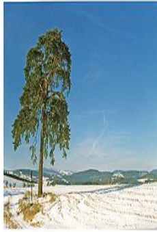
obr. 3. Borovice lesní