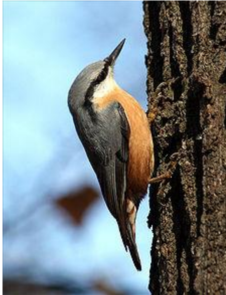
obr. 21. Brhlík lesní

Brhlík lesní makově šedý pták s černou páskou přes oko, který obratně šplhá po stromech, často hlavou dolů. Jeho zpěv je trylkovitý, v základě zní jako „kvikvikvi...“.