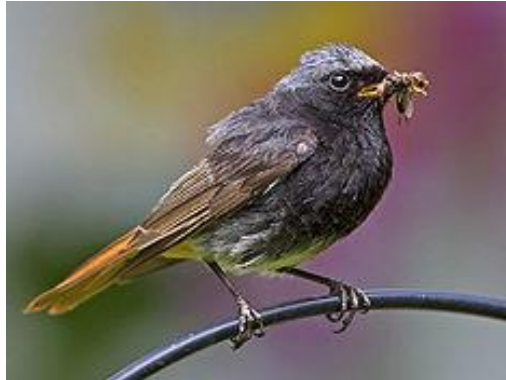
obr. 17. Rehek domácí

Rehek domácí lidově nazývaný čermáček, kominíček. Hnízdí dvakrát do roka, nejvíce se vyskytuje lidských sídel. Je o něco menší než vrabec, od jiných drobných pěvců je dobře odlišitelný díky svému výrazně zářivě oranžovému ocasu, kterým neustále kmitá. Při vábení se ozývá ostrým fit-tek-tek , zpěv má krátký, zvučný s řadou švitoření a vrzavými úseky.