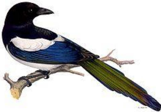
obr.26. Straka obecná

Sojka obecná je oranžovohnědá s černým ocasem a zobákem, hnědýma očima. Na křídlech má modrá pírka. Ostražitý pták, svým varovným pokřikem upozorňuje na nebezpečí.