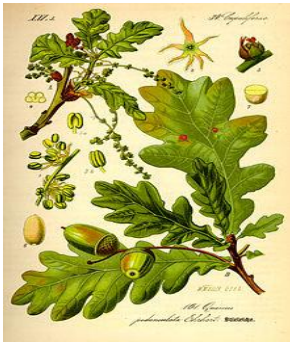
obr.6. Dub letní