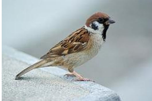
obr. 27. Vrabec polní

Vrabec polní se liší od vrabce domácího, bílými tvářemi s černou skvrnkou a čokoládově zbarvenou hlavou. Hnízdí dvakrát do roka v dutinách stromů ojediněle v budkách.