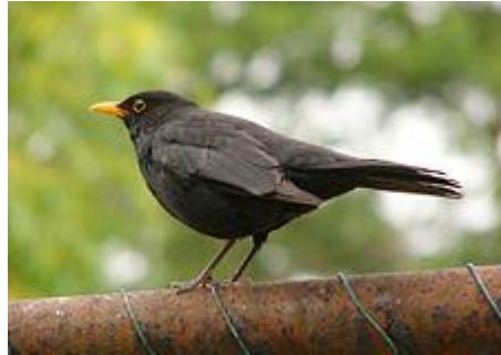
obr. 11. Kos černý

Kos černý je středně velký pták. Dospělý samec je matně černý s oranžově žlutým zobákem a žlutým kroužkem okolo očí. Samice je hnědavá s bělavějším hrdlem a nezřetelně skvrnitou hrudí, zobák i nohy jsou černé. Hnízdí pravidelně dvakrát iroce. Patří k nejlepším zpěvákům.