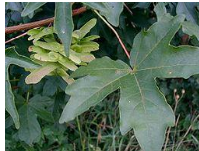
obr. 10. Javor babyka